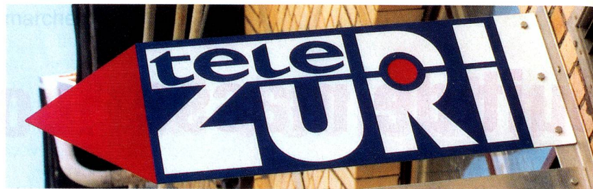
La télévision privée s'est incrustée dans le paysage médiatique, surtout en Suisse alémanique.

Les Suisses alémaniques écoutent plus souvent la radio que les Romands. Les auditeurs plus âgés sont là aussi fidèles à la SSR, tandis que les plus jeunes préfèrent les différentes radios locales.