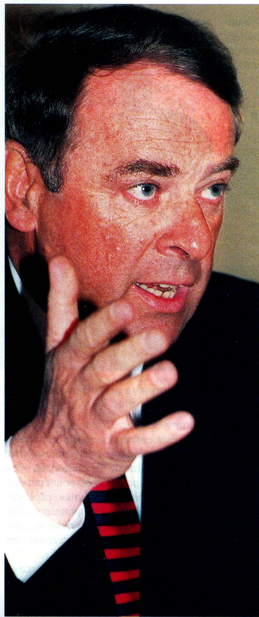
Le conseiller fédéral Adolf Ogi pense que le sport sauvera la Suisse de son isolement.

Monsieur le conseiller fédéral, pourquoi notre pays a-t-il besoin d'une manifestation de l'importance des Jeux Olympiques de 2006?