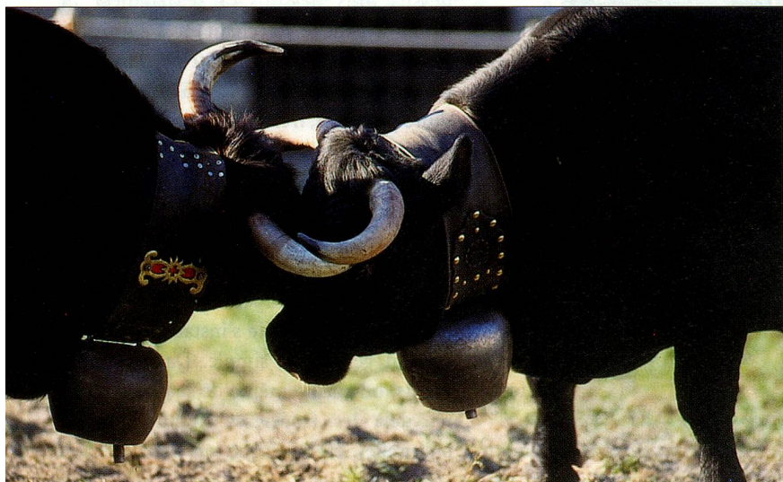
Les solides vaches de la race d'Hérens se livrent des combats spectaculaires en Valais.