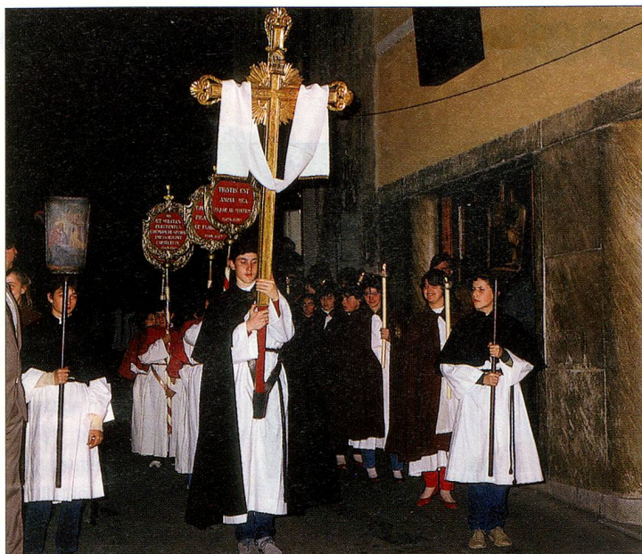
La procession du Vendredi-Saint à Mendrisio (TI) est un rituel religieux impressionnant.