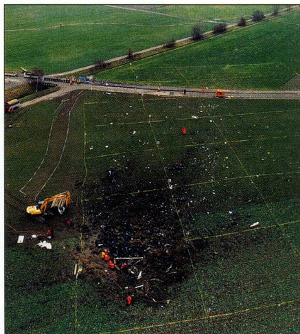
Le Saab 340 de Crossair s'est écrasé près de Niederhasli (ZH) peu après son décollage.

Un avion suisse s'est écrasé en Libye. 22 des 41 occupants de l'appareil affrété par la compagnie aérienne zurichoise Avisto AG