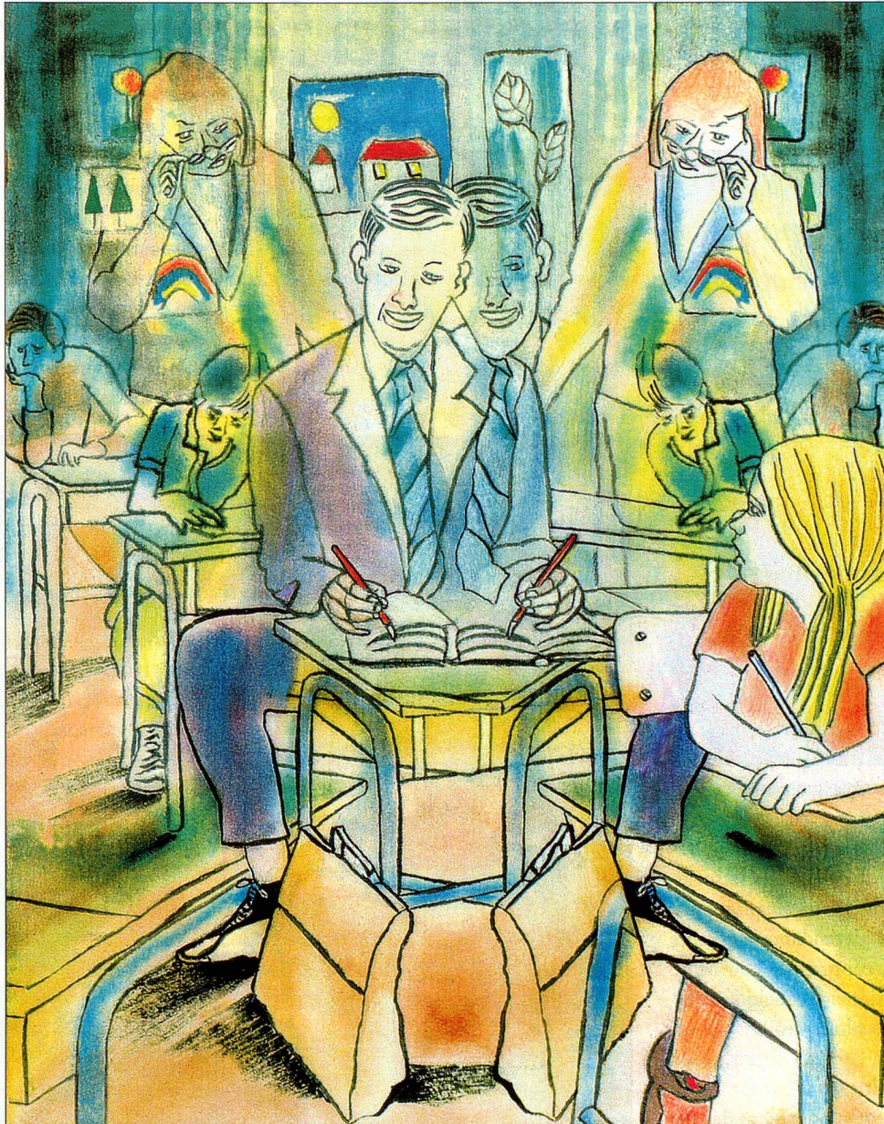
Illustration Eugen Bachmann-Geiser

On n'est jamais trop vieux pour s'asseoir sur un banc d'école.