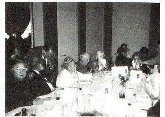
Cérémonie d'ouverture de la fondation de l'Association helvétique en Bourbonnais.

Le 15 octobre a eu lieu le loto de notre société. Comme à notre habitude ce fut une réussite, tant par le choix et la qualité des lots, que par la présence de joueurs en constante augmentation, avec l'aide des membres du comité, que je tiens une nouvelle fois à remercier.