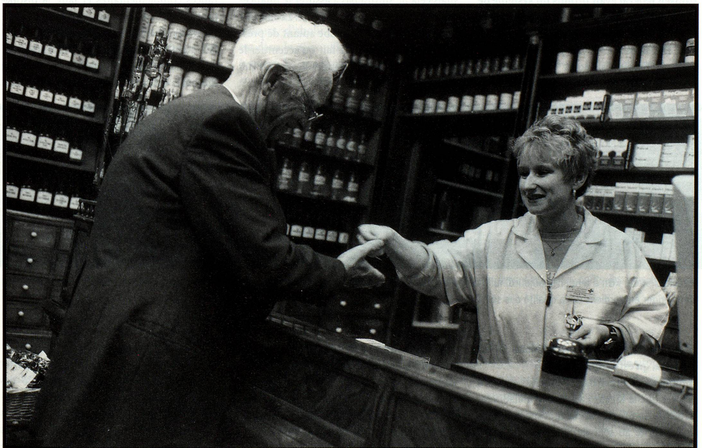
Les pharmaciens aussi veulent être honorés pour leurs services et exigent, dès l'été, une rétribution pour les conseils qu'ils dispensent.