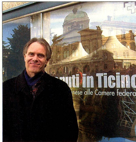
Le président de la Confédération M. Leuenberger à Lugano

Mais ce séjour au Tessin n'a pas été fait que d'excursions et de manifestations conviviales. Le parlement a enfin mené à terme la révision des dispositions du Code pénal relatives à l'interruption de grossesse. Par égard pour le PDC, il a finalement opté