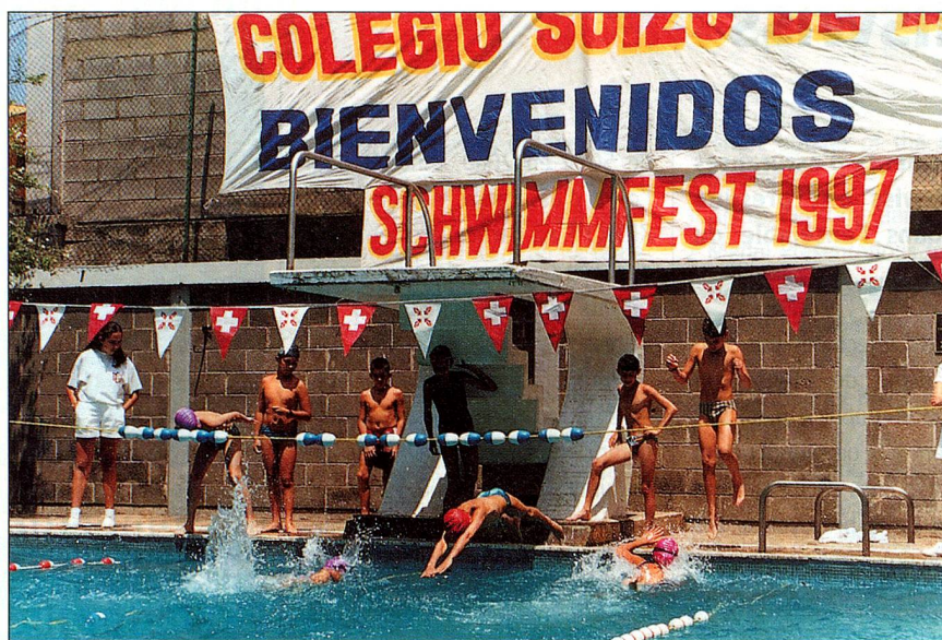
Le sport à l'honneur: l'école suisse à Mexico

«Vous pensez que les Suisses de l'étranger doivent être mieux considérés par le gouvernement et le parlement suisses? Participez aux votations et élections, c'est le meilleur moyen de vous faire entendre!»