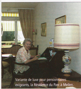
Variante de luxe pour pensionnaires exigeants, la Résidence du Parc à Mülten.