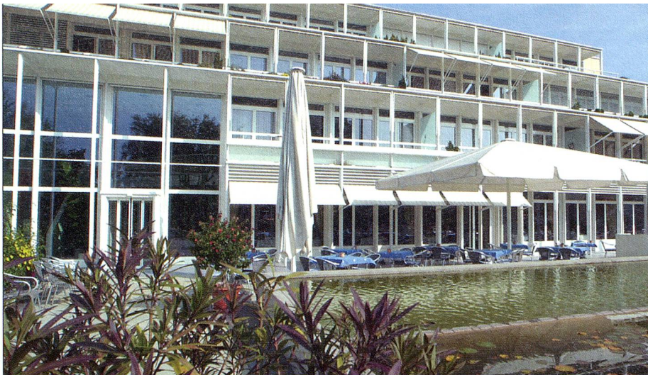
La Résidence du Parc à Meilen.