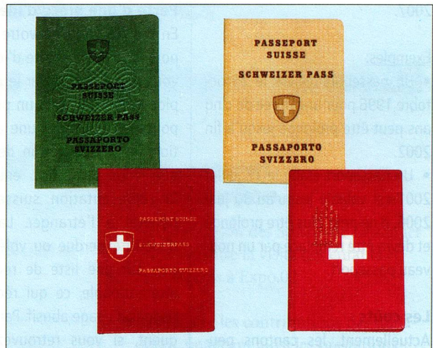
Ce n'est qu'à qu'à partir de 1959 que le passeport suisse a l'aspect d'un livret rouge.

En raison des nouveaux standards élevés en matière de sécurité et des investissements importants qui s'ensuivent sur le plan de la production, l'établissement des passeports sera désormais centralisé en Suisse et ne pourra plus être effectué directement sur place par les représentations compétentes. La nouvelle procédure prolongera en conséquence le délai entre la demande d'établissement du passeport et sa réception (qui pourra prendre jusqu'à 30 jours ouvrables suivant le pays et les vérifications nécessaires). Afin d'éviter tout désagrément, le Département fédéral des affaires étrangères prie tous les Suisses de l'étranger de commander le plus tôt possible, au moins deux mois avant l'échéance de l'ancienne pièce d'identité, leur nouveau