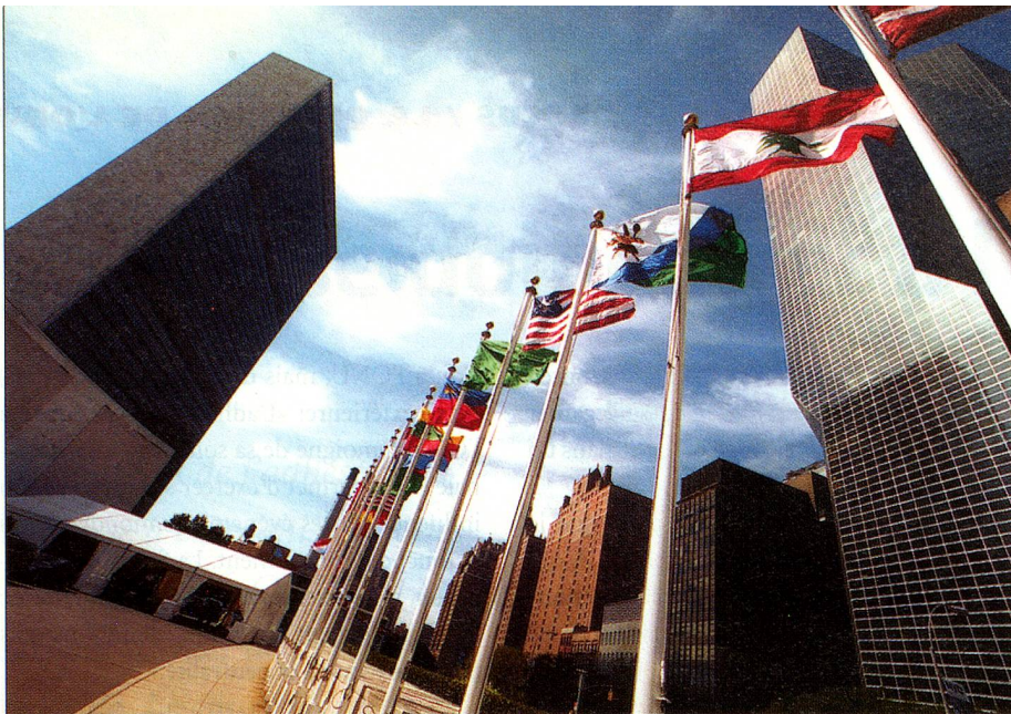
La Suisse et le Vatican absents: drapeaux des nations devant le siège principal des Nations Unies à New York.

exemples historiques qui le démontrent sont légion. N'est-ce pas sous l'influence de l'armée napoléonienne que l'ancienne Helvétie fait pour la première fois l'expérience du principe de la démocratie parlementaire et d'un embryon d'unité nationale? Durant la Première Guerre mondiale, les Romands ont pris le parti de l'Entente tandis que les Alémaniques prennent le parti des puissances de l'Axe – ce qui démontre la relativité des frontières politiques face aux affinités linguistiques.