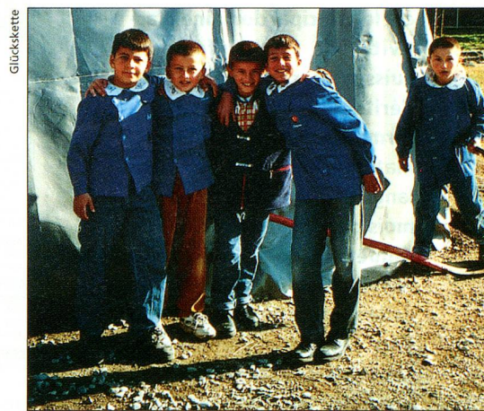
Des classes provisoires ont permis à 26 000 enfants de retourner à l'école après le tremblement de terre en Turquie.

Pourquoi la Chaîne du Bonheur s'intéresse-t-elle tant à votre adresse e-mail? En cas de catastrophe, les collectes sont mises sur pied en quelques jours. Internet est le seul moyen de vous contacter rapidement où que vous soyez dans le monde. Avec swissinfo/SRI (également partenaire de cette action), c'est la seule façon pour vous de prendre connaissance à temps des dates de