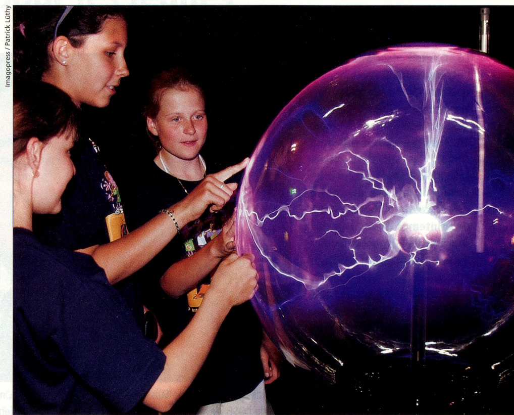
La place d'études suisse doit être soutenue. Sur l'image, jeunes gens au Technorama de Winterthur.

Pour la Suisse, il s'agit d'une perte de capital humain qui risque d'avoir des conséquences négatives dans un proche avenir: sans innovation, le développement économique est menacé, a affirmé le «ministre» de l'intérieur, Pascal Couchepin. Si tous les partis tombent d'accord sur le principe d'allouer des ressources plus importantes à ce secteur, le problème du financement divise toujours les esprits. Alors qu'en novembre 2002 le Conseil fédéral s'était dit prêt à relever les crédits à la recherche de 6 % (soit 17,3