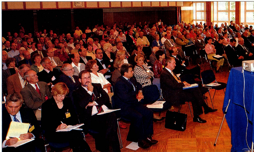
Le 81 e Congrès des Suisses de l'étranger se consacre à Crans-Montana à la place financière suisse.

Le secteur financier joue un rôle vital dans notre pays. Près de 400 personnes ont donc assisté au 81 e Congrès des Suisses de l'étranger à Crans-Montana et se sont informées, le samedi, auprès de représentants de haut vol du monde bancaire et de la politique sur l'avenir de la place financière suisse.