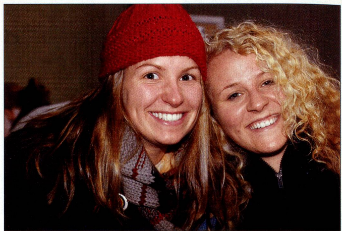
L'occasion de se faire des amis.