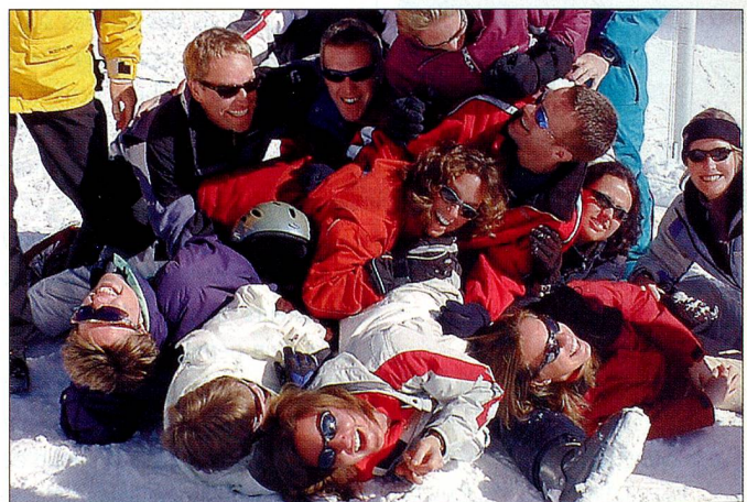
Des pistes superbes pour tous.

Il y a encore des places pour le camp de Pâques de l'Organisation des Suisses de l'étranger (OSE). Les jeunes se retrouvent dans le Fieschertal du 4 au 12 avril pour y jouir de la neige de printemps de la région de l'Aletsch.