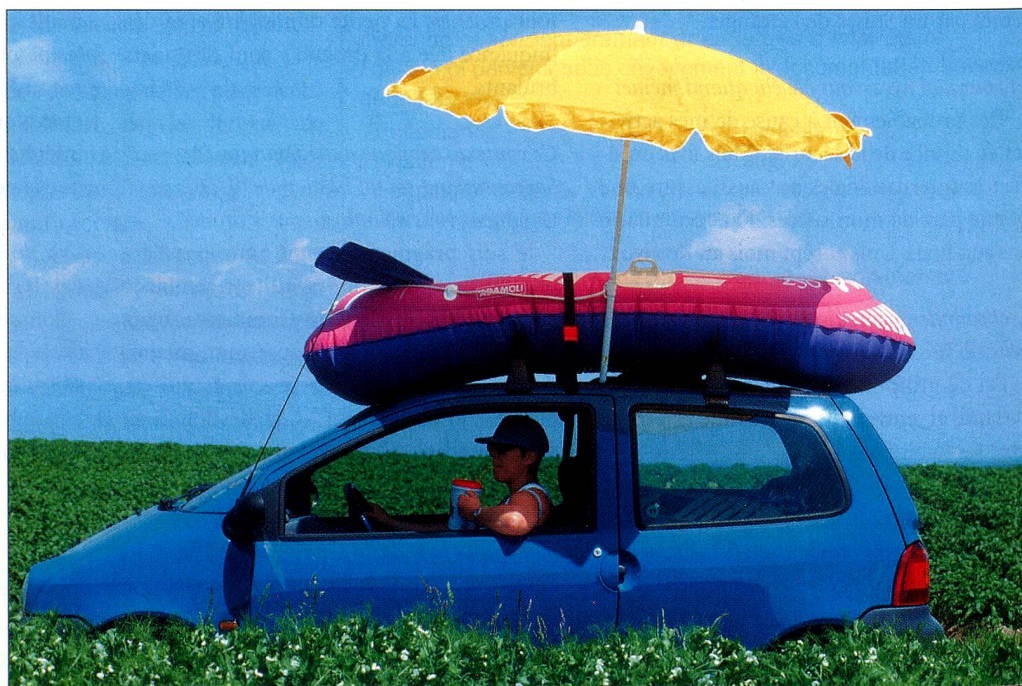
S'informer de la sécurité de sa destination de vacances importe aujourd'hui autant que charger correctement sa voiture.