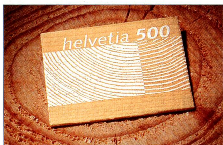
En bois: l'accent a été mis sur la matière première durable et polyvalente lors de la réalisation et de la conception du timbre, soulignant ainsi non seulement le caractère unique de ce timbre mais aussi l'esprit novateur de la Poste.