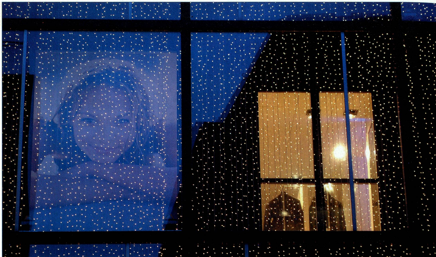
Les lumières de Noël transfigurent les maisons et font briller les yeux des enfants.