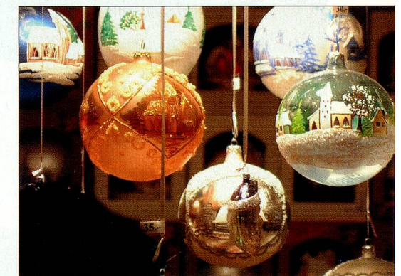
Boules de Noël soufflées par des enfants.