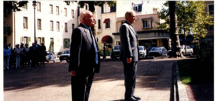
Jour de fête nationale et d'hommage.

L'Hermitage. 03120 Saint Prix. Tél 04 70 99 32 90. Président : Herbert Marschall