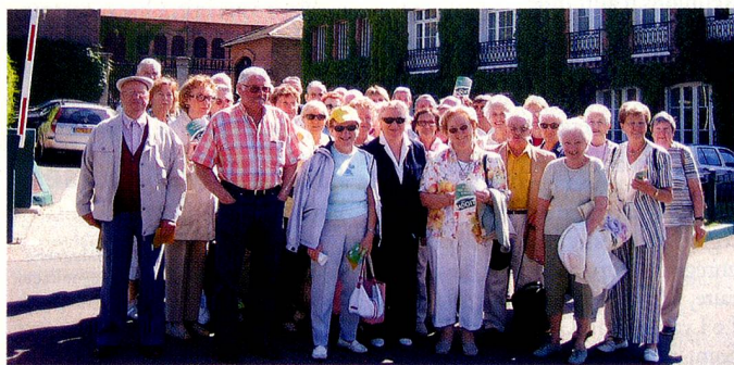
L'Amicale des Suisses d'Annemasse et environs.

Janvier 2006 : repas choucroute à l'hôtel de l'Arve à Chamonix.