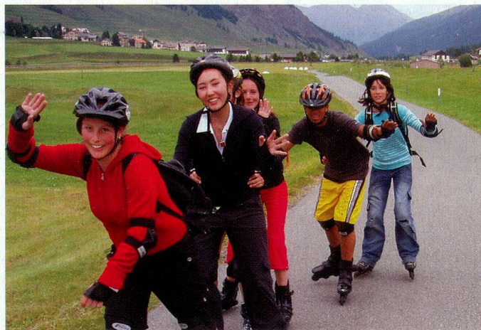
Patin en ligne autour de La Punt (Engadine)

Quelques mordus se retrouvent depuis des années à ce camp. Les nouveaux participants sont bienvenus. Une semaine de sports de neige sous toutes leurs formes et des contacts avec des Suisses de l'étranger du monde entier.