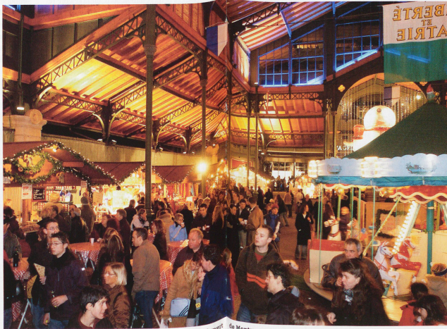
Au marché couvert de Montreux

tion des bougies, par là le Père Noël donne audience. Dénombrer les marchés de Noël dans notre contrée, c'est chercher des edelweiss sous un manteau de neige. En une dizaine d'années, l'engouement pour ces rassemblements a explosé. Petits ou grands, authentiques ou carrément à côté du sujet, ces marchés d'origine germanique (Alsace, Bavière) ont séduit les Helvètes. L'hiver s'anime. Les ruelles scintillantes voient naitre des villages de maisonnettes en bois, de stands. A l'hibernation de jadis se substitue la chaleur de l'échange culturel, commercial et social. Du tourisme contemplatif dans un décor féérique. Le fantastique qui s'en dégage. Les choses simples (travail du bois, d'artisans) oubliées d'une société pressée et haletante, contribuent pour beaucoup à ce succès.