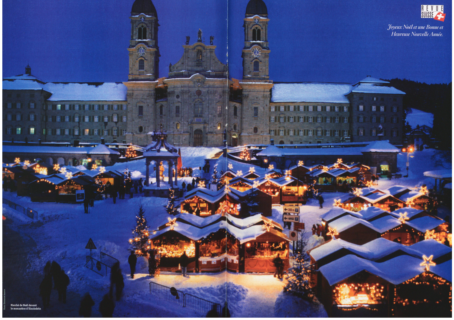
Marché de Noël devant le monastère d'Einsiedeln