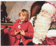
Magie de Noël pour petits et grands

Un feu crépite dans l'âtre d'une maisonnette en bois. Une mélodie séculaire réveille des souvenirs scintillants. Des cœurs s'adoucissent le temps de l'Avent. Les yeux des enfants brillent lorsqu'ils écoutent les contes de fées. Au fil du mois de décembre, période de gourmandise où l'on fait bonne chair, les marchés de Noël réanniment les saveurs d'autan. Par ci, on confec-