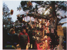
Stans, centre du village

Du côté de la cité historique de Willisau (LU), le 9 e marché de Noël (100 stands) prend place du 1 er au 4 décembre au centre-ville (là où les marchés conventionnels ont lieu depuis le Moyen Âge). Quant au marché de Noël de Brunnen dans le canton de Schwyz, il est pour