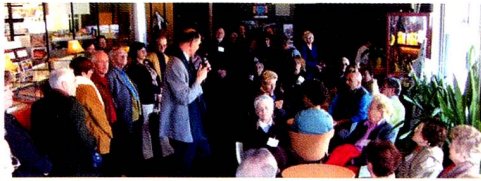
Visite du musée d'Agropolis le 18 mars dernier

Lors de notre Assemblée générale ordinaire du 18 mars, à laquelle une bonne centaine de personnes ont participé, le programme suivant a été adopté : Dimanche 20 mai, réunion de printemps. Mercredi 1 er août, fête nationale. Dimanche 4 novembre, journée en péniche.