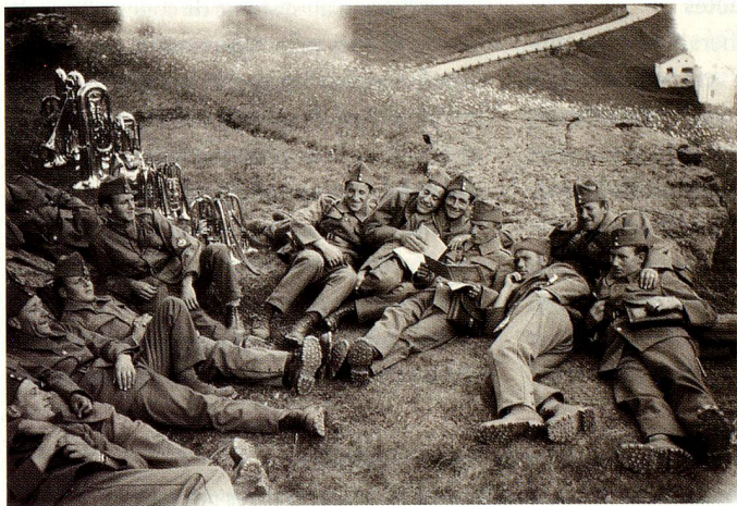
Pause, printemps 1940