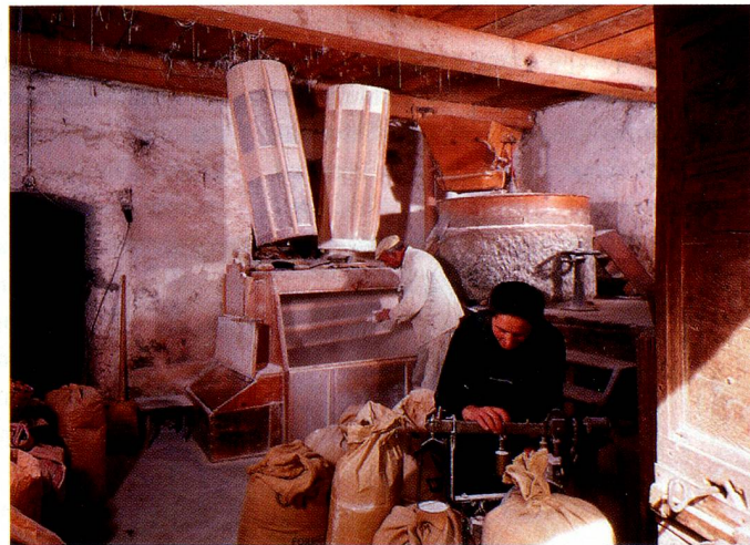
Moulin à grains à Poschiavo.