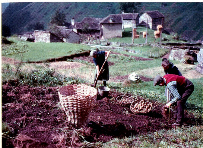
Ramassage de pommes de terre à Malvaglia.