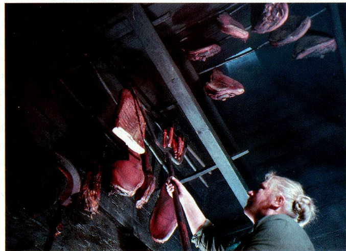
Fumoir dans le Val d'Illier.