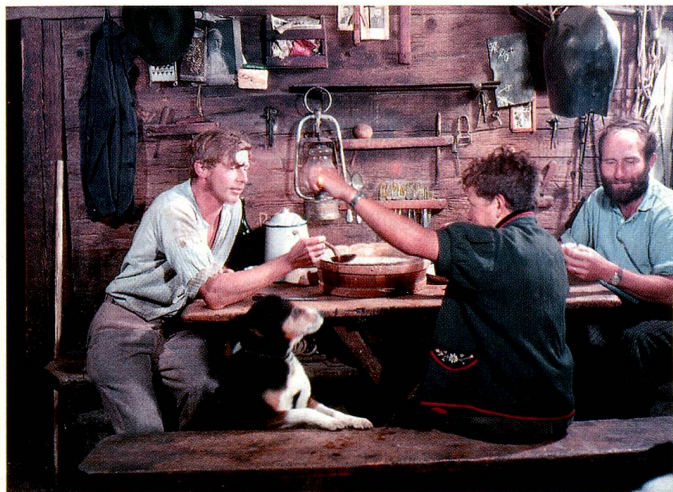
«Suifi», boisson à base de petit-lait, sur l'alpage de Gummen, à Nidwald.