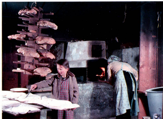
Cuisson du pain à Lugnez.