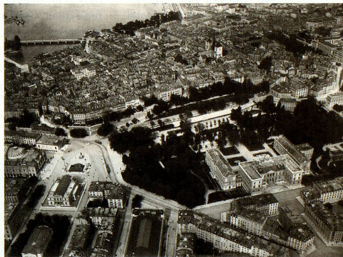
Genève, la vieille ville avec le Parc des Bastions et la cathédrale, vus du sud-ouest.