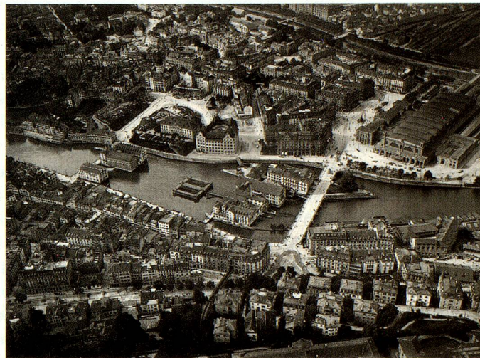
Zurich, la vieille ville et la gare centrale, vus de l'est, 1909/1910.