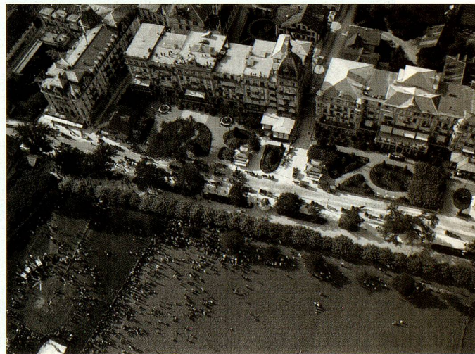
Interlaken avec le site de décollage du ballon.