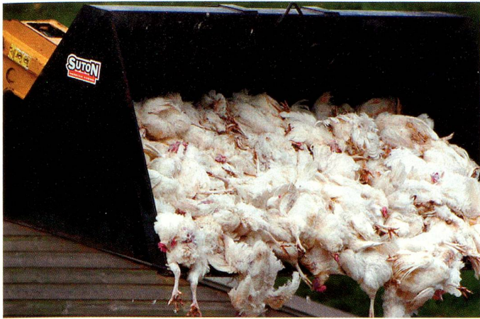
Abattage d'urgence de poulets en Angleterre, en avril 2006.

Géorgie, Guatemala, Honduras, Hong Kong, Inde, Indonésie, Iran, Israël, Jamaïque, Jordanie, Kenya, Koweït, Laos, Liban, Libye, Macédoine, Malaisie, Maroc, Ile Maurice, Mexique, Monténégro, Nicaragua, Sultanat d'Oman, Pakistan, Paraguay, Pérou, Philippines, Qatar, République dominicaine, Roumanie, Russie, Serbie, Singapour, Sri Lanka, Taïwan, Thaïlande, Tunisie, Turkménistan, Ukraine, Uruguay, Vénézuéla, Viêtnam