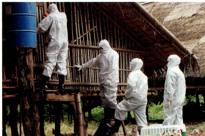
Intervention contre la grippe aviaire dans un élevage avicole en Thaïlande, en août 2006.