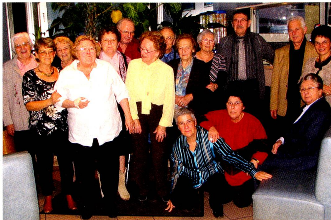
Repas du Grillon novembre 2007

Le président et son bureau souhaitent à tous les adhérents les meilleurs vœux pour l'année 2008. Quelques mots amicaux pour certains adhérents dans la maladie en leur souhaitant courage et prompt rétablissement.