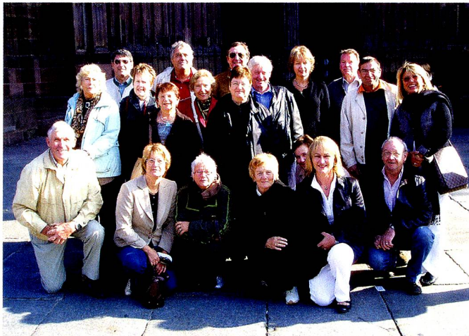
Le groupe devant la cathédrale de Strasbourg

Voyage en Alsace, octobre 2007. Nous gardons de ces deux jours un excellent souvenir ! Les visites guidées de Colmar et de Strasbourg nous ont permis de redécouvrir ces deux villes. Ayant allié la gastronomie au culturel, le car est rentré le coffre rempli de cartons de bouteilles et de délicieux biscuits de Noël alsaciens. A refaire !