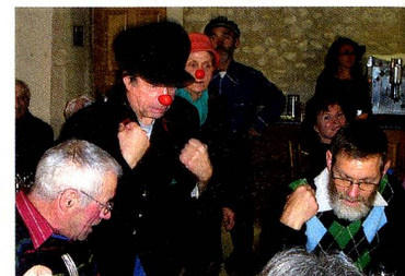
Les clowns amateurs au boulot!