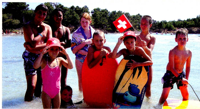
Les "forces vives" de l'amicale les pieds dans l'eau, au soleil.