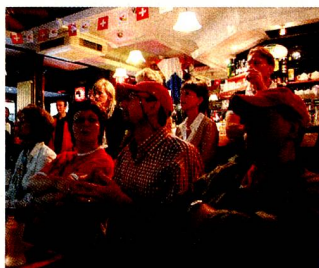
Chaude ambiance pendant l'Euro au "Vin Bis"