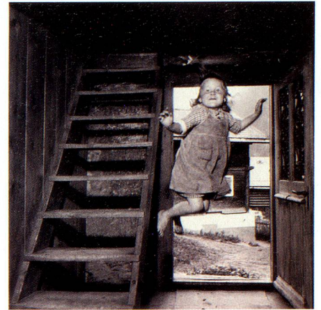
Le saut, 1955, photo de Theo Frey.