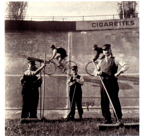
Vélodrome, Zurich-Oerlikon, années trente.