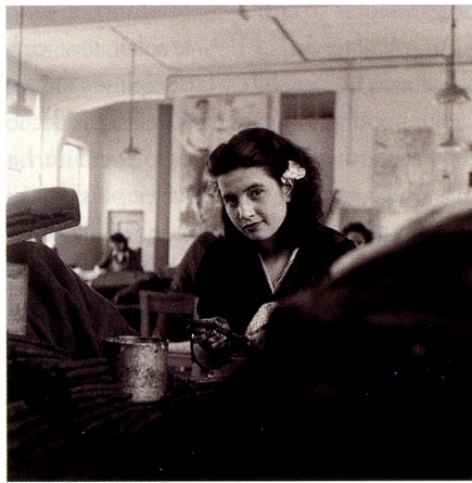
Ouvrière dans un fabrique de cigarettes, Brissago, 1947.