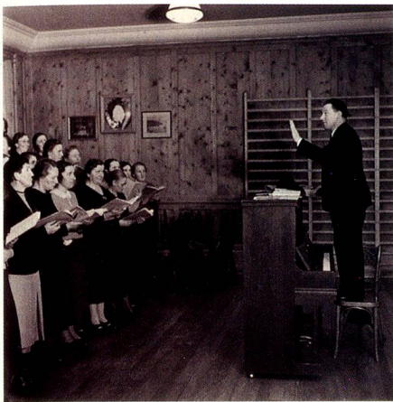
Répétition de chant, Zuoz, 1939.