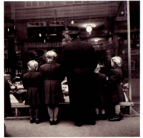
Dimanche avant Noël, Zurich, 1948.