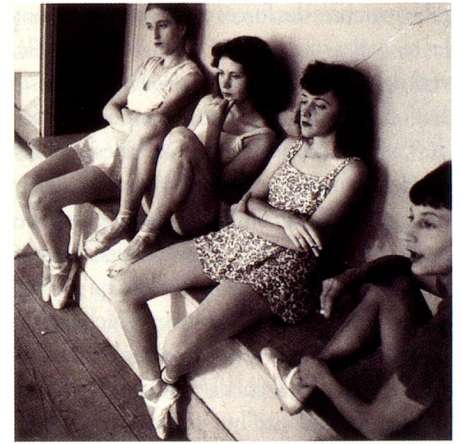
Danseuses, Genève, 1941.