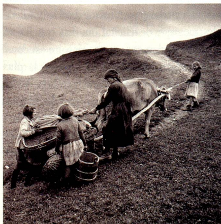
Charretée de pommes de terre à Obersaxen, Plategna GR, 1948.