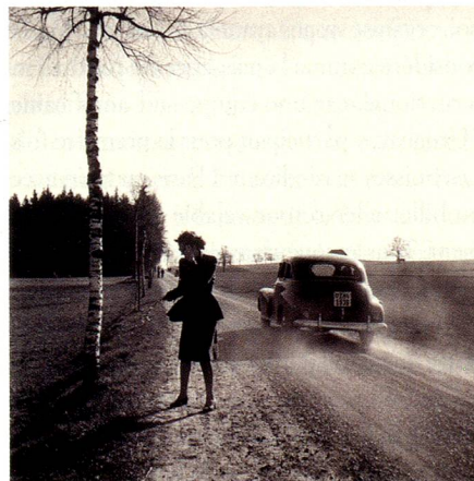
Traffic routier, canton de Zurich, vers 1949.