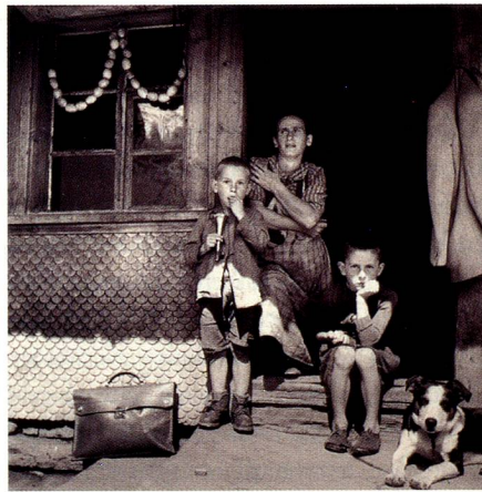
Flühli, Entlebuch, 1941.