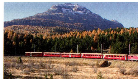
Le chemin de fer rhétique – tiré de la publication «Les plus beaux moyens de transport de Suisse» (page 7).