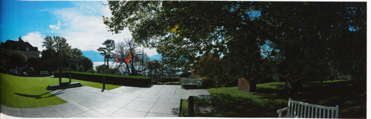
Le Musée Olympique de Lausanne est situé dans un parc de 22'000 m 2 .

L'art et le sport sont ici toujours intimement liés, comme par exemple une sculpture en bronze d'Auguste Rodin, de 1904, nommée «l'athlète américain». Les symboles des Jeux, ses instigateurs, des espaces interactifs multimedia, jalonnent l'exposition: les cinq anneaux symbolisant les cinq continents qui apparaissent pour la première fois à Anvers en 1920, l'ampleur du mouvement olympique dans le monde, les détails économiques, les médailles, estampes, pièces de monnaie, timbres, les présidents successifs du CIO, etc. La deuxième exposition permanente, «Les Athlètes et les Jeux», présente les équipements de différentes disciplines des J.O. d'été et d'hiver et leur évolution. Face au lac, le vaste jardin du musée et ses imposantes sculptures de grands artistes accueillent le visiteur. Modernité et interactivité sont en