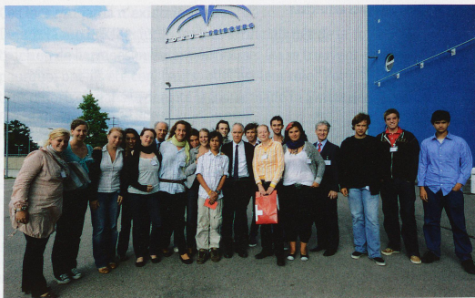
86 e Congrès des Suisses de l'étranger à Fribourg