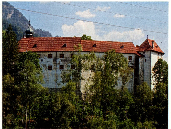
Le château de Rhäzüns, résidence secondaire de la famille Blocher.