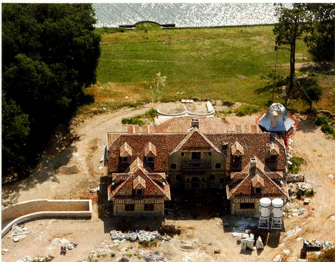
La propriété de Michael Schumacher sur les bords du lac Léman.

■ Prestations complémentaires: si les rentes de l'AVS ou de l'Assurance invalidité ne suffisent pas à couvrir les frais nécessaires à garantir le minimum vital, des prestations complémentaires sont versées par l'Etat. Ce droit à des prestations de ressources sous condition est inscrit dans la loi. Pourtant, seule la moitié des ayants droit fait valoir ce droit. «Les prestations complémentaires ont con-