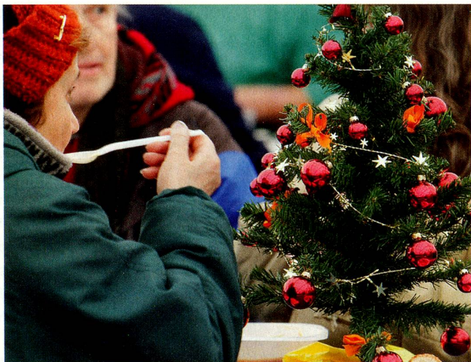
Fête de Noël pour les personnes nécessiteuses à Lausanne.