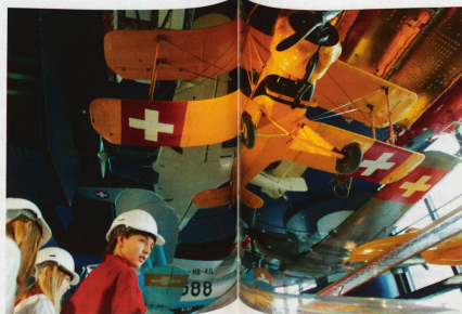
L'histoire de l'aviation.