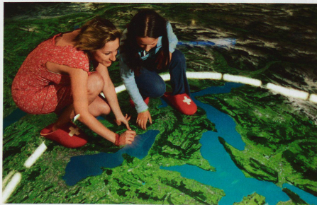
La Suisse à vos pieds.

Le Musée Suisse des Transports et de la Communication continue pourtant à se transformer en permanence sous la direction actuelle de Daniel Suter. Le 3 novembre de cette année, le nouveau bâtiment d'entrée «Future Com» avec un centre de conférence moderne, un restaurant, le monde de communication interactif «Media-Factory» et la boutique du musée sera mis en service dans le cadre de la première partie des projets de construction. À la mi-2009, la nouvelle halle du transport routier ainsi qu'un terrain multifonctionnel en plein air pour les expositions spéciales seront inaugurés au sein du musée. www.verkehrshaus.ch