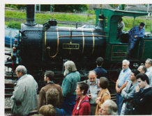
Une manne pour les passionnés des chemins de fer.