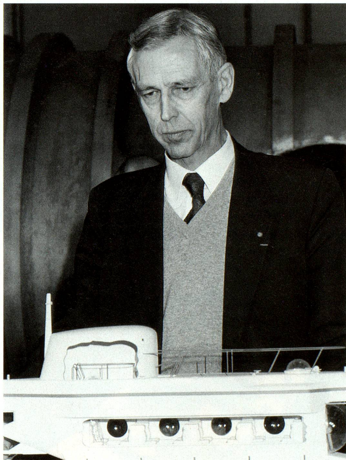
L'océanologue Jacques Piccard, père de l'aventurier Bertrand Piccard, est décédé à l'âge de 86 ans. En 1960, il avait battu le record de profondeur en plongeant avec son sous-marin à 11 000 mètres dans la fosse des Mariannes. Un record jamais égalé.

■ Le couteau qui arme tous les soldats du pays sera toujours fabriqué en Suisse. Face à six concurrents, dont des étrangers, la société Victorinox a été choisie pour produire la nouvelle version de cet emblème national.