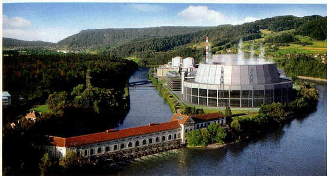
Le projet soumis à Beznau.

La branche électrique avertit: sans nouvelles grandes centrales électriques, l'approvisionnement en électricité dans le pays peut être menacé. A-t-on réellement besoin de nouvelles centrales nucléaires ou à gaz, ou bien l'électricité «verte» est-elle en mesure de garantir l'avenir énergétique? Par Rolf Ribl