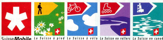
SuisseMobile La Suisse à pied La Suisse à vélo La Suisse en rollers La Suisse en canot

facilement utilisable. Plus de 500 logements de différentes catégories peuvent être réservés via Swiss Trails et tous sont reliés entre eux par des transports quotidiens et individuels de bagages. En outre, on peut par exemple louer un vélo à n'importe quel lieu d'étape, même s'il n'y a aucune station de location à proximité – Swiss Trails apporte les bicyclettes à l'endroit que vous souhaitez.