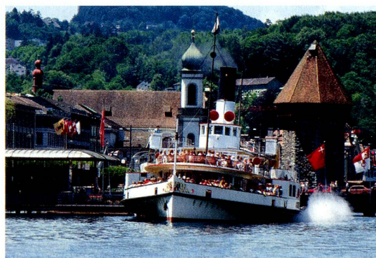
Lucerne. Un bateau à vapeur de la flotte du lac des Quatre-Cantons à l'embarcadère de la gare.

Sur www.MySwitzerland.com/aso , Suisse Tourisme présente différentes offres pour de courts et longs séjours en Suisse. Les offres top sont jusqu'à 35% moins chères et disponibles régulièrement.