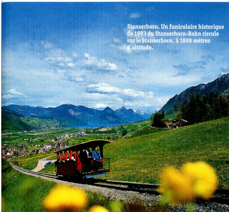
Stanserhorn. Un funiculaire historique de 1893 du Stanserhorn-Bahn circule sur le Stanserhorn, à 1898 mètres d'altitude.