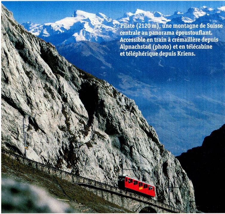
Pilate (2120 m), une montagne de Suisse centrale au panorama époustouflant. Accessible en train à crémaillère depuis Alpnachstad (photo) et en télécabine et téléphérique depuis Kriens.