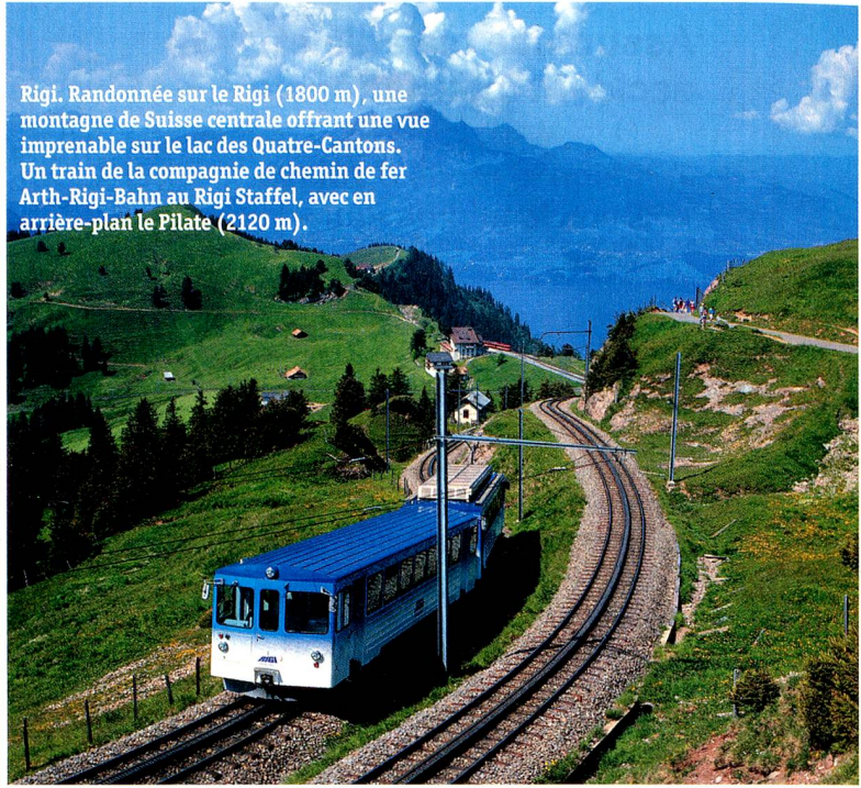
Rigi. Randonnée sur le Rigi (1800 m), une montagne de Suisse centrale offrant une vue imprenable sur le lac des Quatre-Cantons. Un train de la compagnie de chemin de fer Arth-Rigi-Bahn au Rigi Staffel, avec en arrière-plan le Pilate (2120 m).