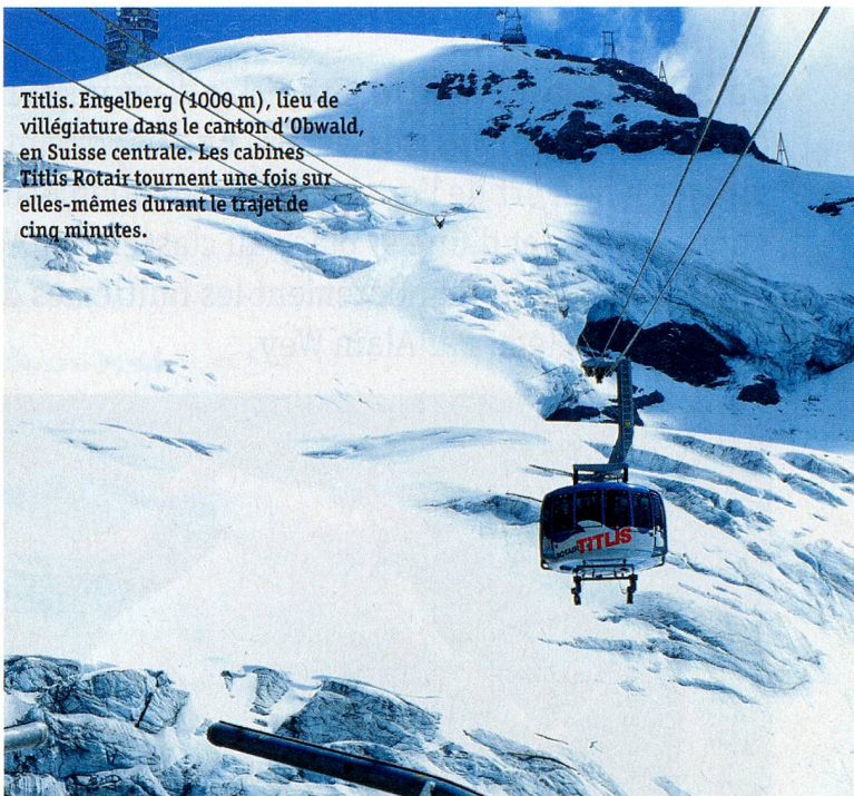
Titlis. Engelberg (1000 m), lieu de villégiature dans le canton d'Obwald, en Suisse centrale. Les cabines Titlis Rotair tournent une fois sur elles-mêmes durant le trajet de cinq minutes.

également à la détente. Titlis, la montagne emblématique d'Engelberg, et son parc glaciaire sont accessibles par le Rotair, un téléphérique tournant. À 3020 mètres d'altitude s'offre à nos yeux émerveillés un panorama grandiose sur les Alpes centrales. C'est à pied, grâce à différents sentiers thématiques (sentier des fleurs alpines, sentier «des chatouilles», sentier Kneipp, etc.) que l'on découvrira