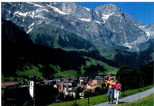
Engelberg (1000 m) dans le canton d'Obwald en Suisse centrale. Monastère bénédictin du XIII e siècle.

au mieux le paysage. Le paradis de la randonnée de Trübsee, point de départ idéal pour des randonnées de découverte de plusieurs lacs, est à mi-chemin du Titlis.