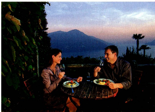
Un grotto au Tessin

Les «Chügelipastete» lucernoises, dont l'origine remonte au XVIII e siècle, font partie des spécialités historiques de