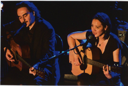
Deux artistes qui donnent le ton: Stephan Eicher et Sophie Hunger.