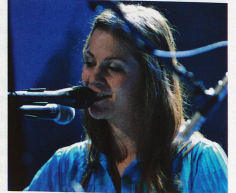
Heidi Happy de Lucerne: en route vers le firmament.

Distribution Irascible www.myspace.com/heidihappy