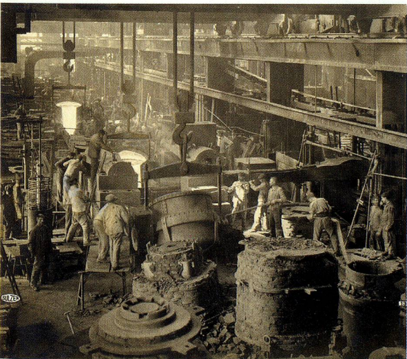
Atelier de fonderie Sulzer, à Winterthur, 1919