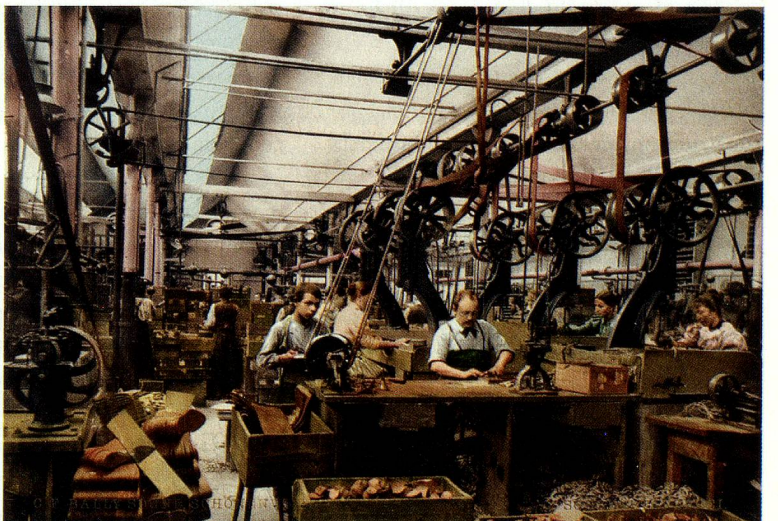
Menuiserie de la cordonnerie C.F. Bally, à Schönenwerd, vers 1900