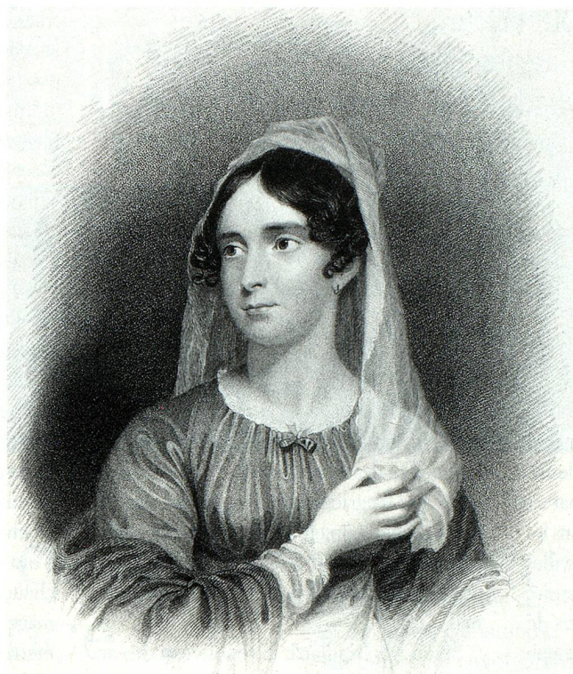
Anne Isabella Noel Byron (1792-1860), l'épouse Lord Byrons

s'approprier Genève. Ils atteignent ensuite Clarens, toujours sur les pas de Rousseau. Ils arrivent enfin à Ouchy (Lausanne) où Byron compose avec une rapidité extrême Le prisonnier de Chillon le 28 juin. L'écho littéraire de ce tour du lac va être immense. De retour, Byron passe les mois de juillet et août dans la villa Diodati... écrivant, se promenant, naviguant et accueillant parfois des hôtes venus d'Angleterre. Il rend aussi fréquemment visite à l'écrivain Mme de Staël à Coppet, qui, élogieuse, lui clame: «Le lac Léman vous doit de la reconnaissance, Mylord!» Le 29 août, les Shelley quittent Coligny pour l'Angleterre et Byron part pour Chamonix et le Mont-Blanc.