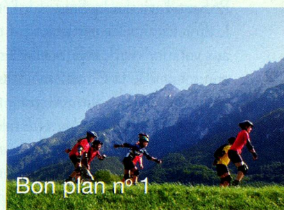
Bon plan n° 1

Le long de la vallée du Rhin et du lac de Constance, sur des routes asphaltées, l'itinéraire est idéal, même pour les patineurs peu expérimentés. Sa séparation du trafic motorisé permet aux familles avec enfants de jouir pleinement des plaisirs du roller.