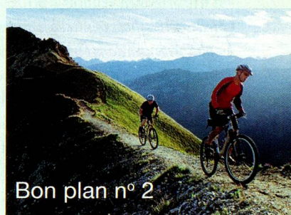
Bon plan n° 2

Des vignobles aux régions de ski, des centres touristiques aux petits villages tranquilles de montagne, vous traversez des alpages pittoresques, des torrents frais et des chemins magnifiques en profitant d'une vue imprenable sur la vallée du Rhône.