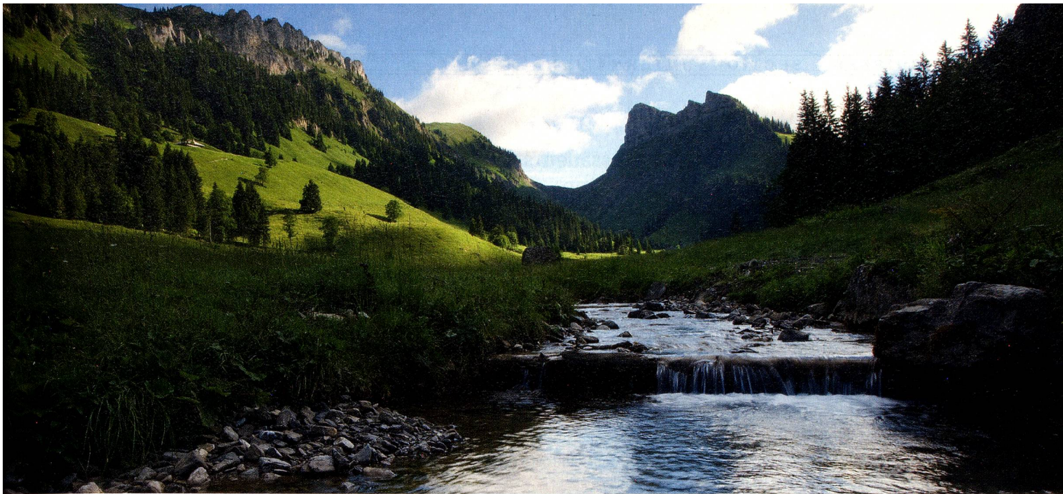
Justistal, parc naturel lac de Thoune-Hohgant, Oberland bernois