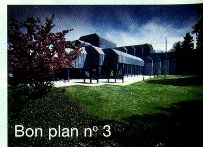
Bon plan n° 3