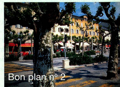
Bon plan n° 2