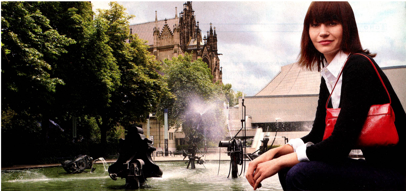
Fontaine Tinguely, Bâle