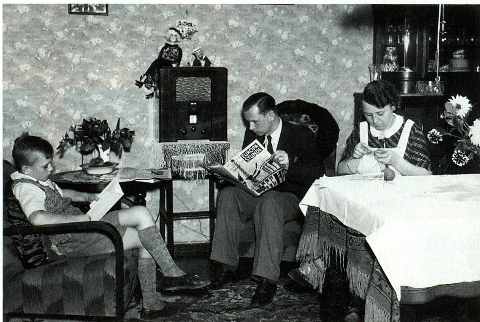
Une famille avec sa radio - image de l'année 1936