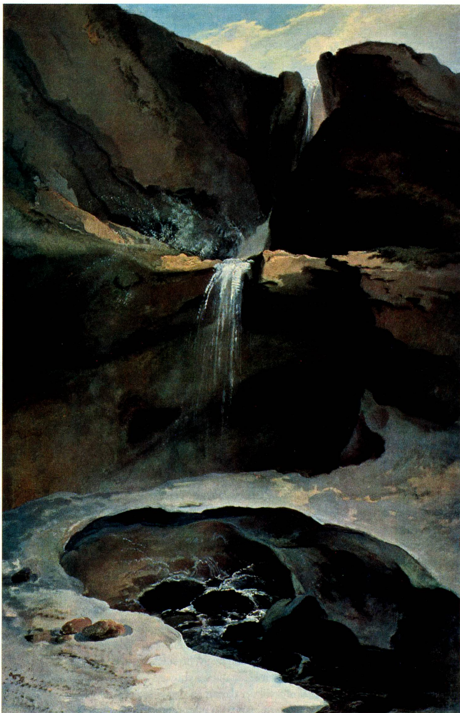
«Der Geltenbachfall im Winter», de (1735-1783).

C'est un grand thème suisse dont on parle souvent dans la presse. Il naît au XVIIIe siècle où la Suisse se profile hors des mouvements historiques pour les voyageurs qui viennent ici voir fonctionner des modèles de démocratie. Ils s'imaginent que c'est là un témoignage qui a survécu depuis les temps les plus reculés. Ce qui est une erreur de jugement. Le concept d'île préservée n'est pas inventé par les Suisses mais par les gens venant d'ailleurs. Les Helvètes vont ensuite se l'approprier comme une espèce de définition justifiant une certaine façon de défendre la neutralité avec conviction.