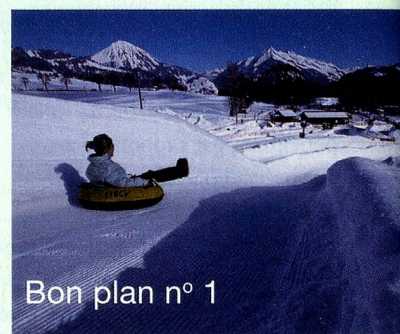
Bon plan n° 1

Ski, snowboard, ski de fond, Leysin et son domaine skiable sont un vrai paradis de la glisse. Ici, elle se pratique même sur un glacier, à plus de 3000 mètres d'altitude, ou sur des chambres à air, au Tobogganing Park. Sensations fortes garanties.