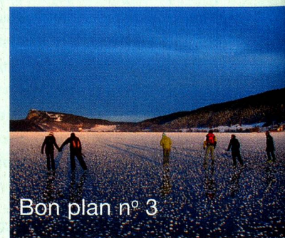
Bon plan n° 3

Amateurs de ski de fond, ici vous attend un des plus vastes domaines d'Europe. Pour profiter des magnifiques paysages du Jura, il est aussi recommandé de troquer ses skis de fond contre des raquettes ou même des patins, pour glisser sur le lac de Joux.