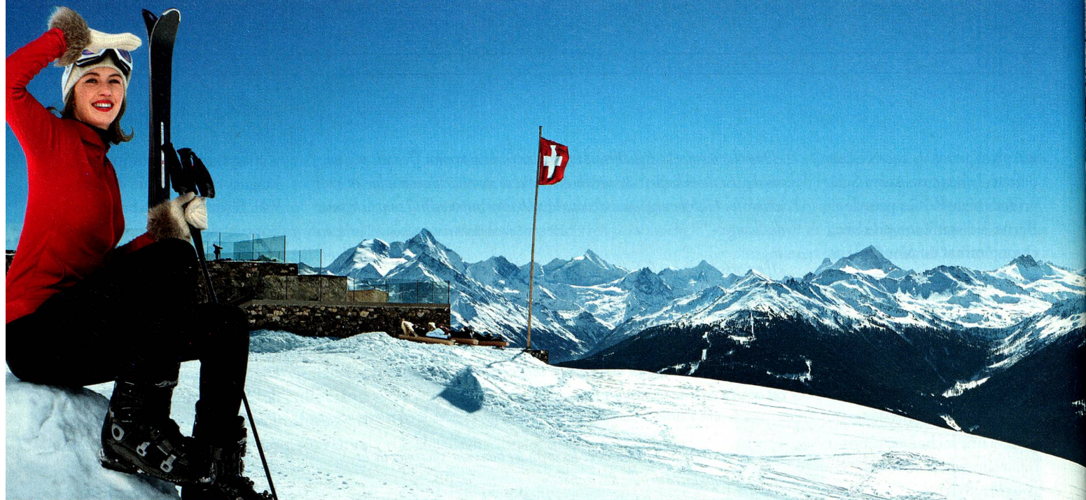
Chetzeron, Crans-Montana, Valais